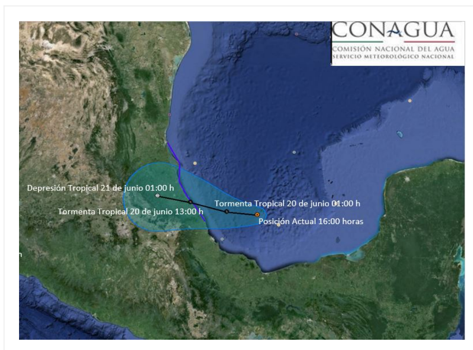
Imagen de trayectoria de la Depresión Tropical "Cuatro"